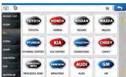
■ Selección de fabricante