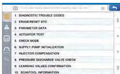
■ Selección de menú