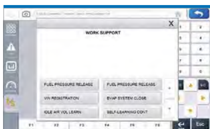
■ Funcion Especial