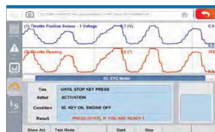
■ Doble visualizacion Sensores/Actuadores